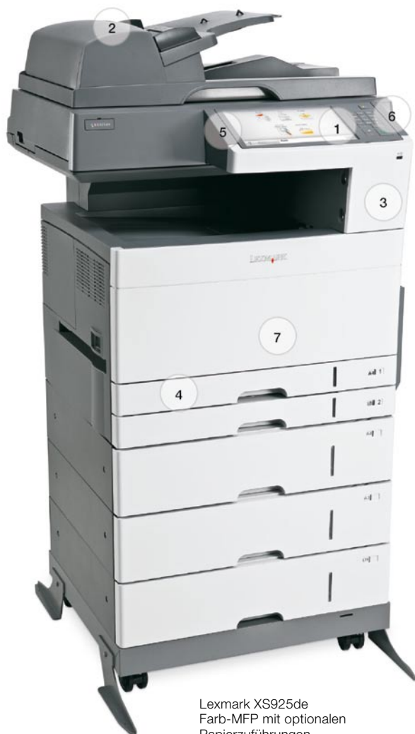
Lexmark XS925de Farb-MFP mit optionalen Papierzuführungen.